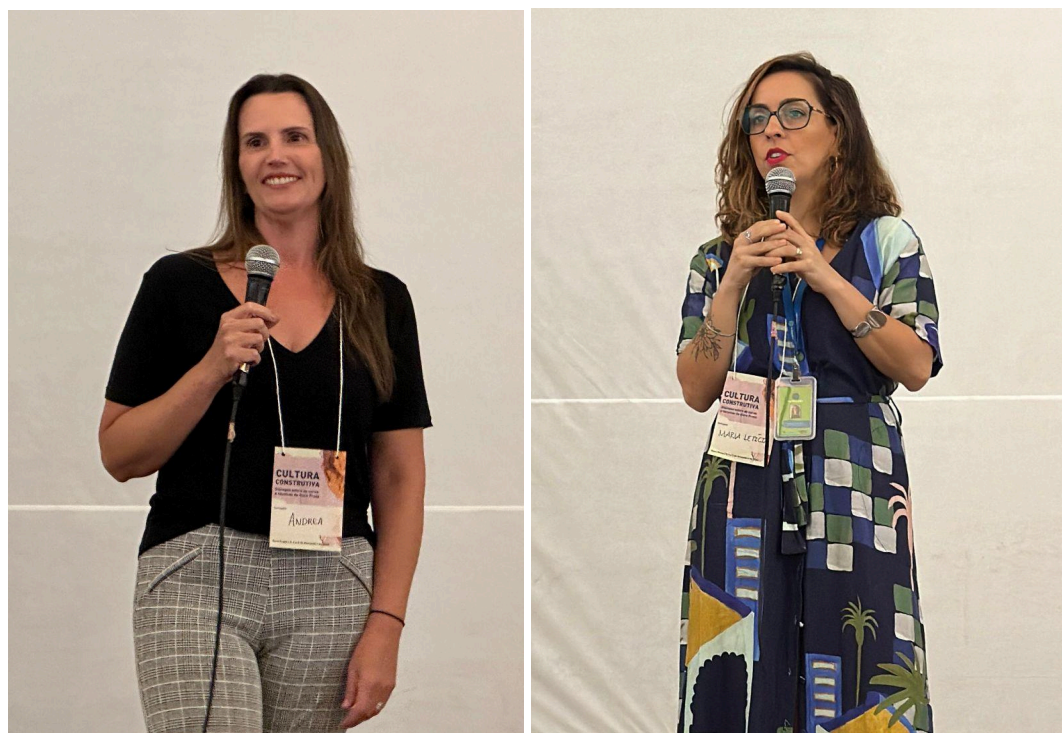
Fala institucional da CPPC/MPMG e Plataforma Semente

O seminário foi muito bem recebido pelas representantes do Ministério Público, órgãos de patrimônio, pela comunidade acadêmica e pelos participantes, em especial os moradores locais que revisitaram as memórias da antiga cidade e tiveram uma voz ativa na construção de diretrizes para conservação das técnicas tradicionais e das cores das fachadas que compõem a paisagem ouropretana.