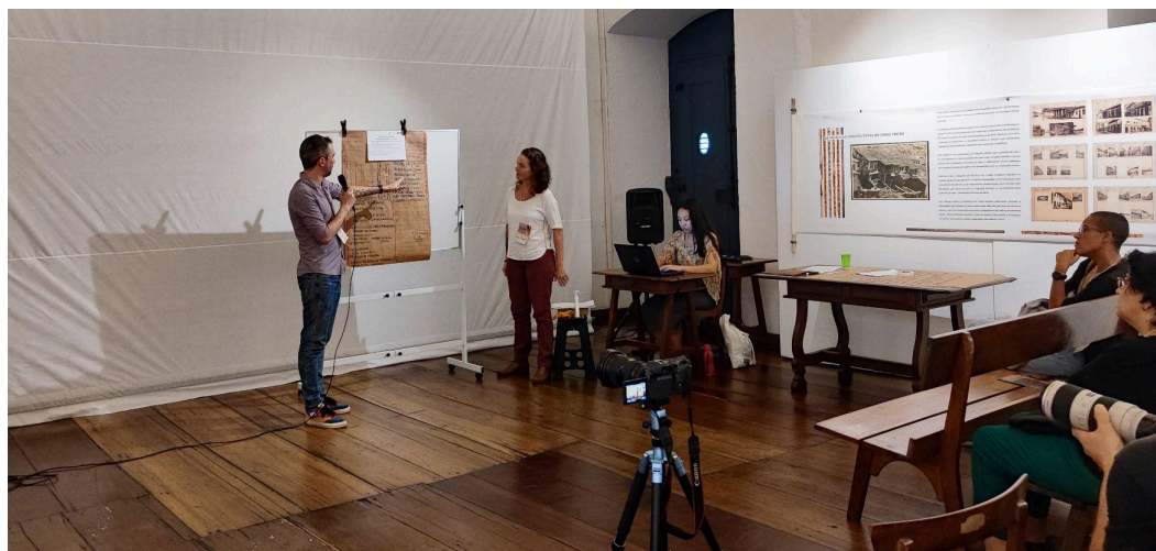
Apresentação das instituições envolvidas nos projetos

os professores consultores apresentaram sobre temas relacionados aos projetos e teceram contribuições.