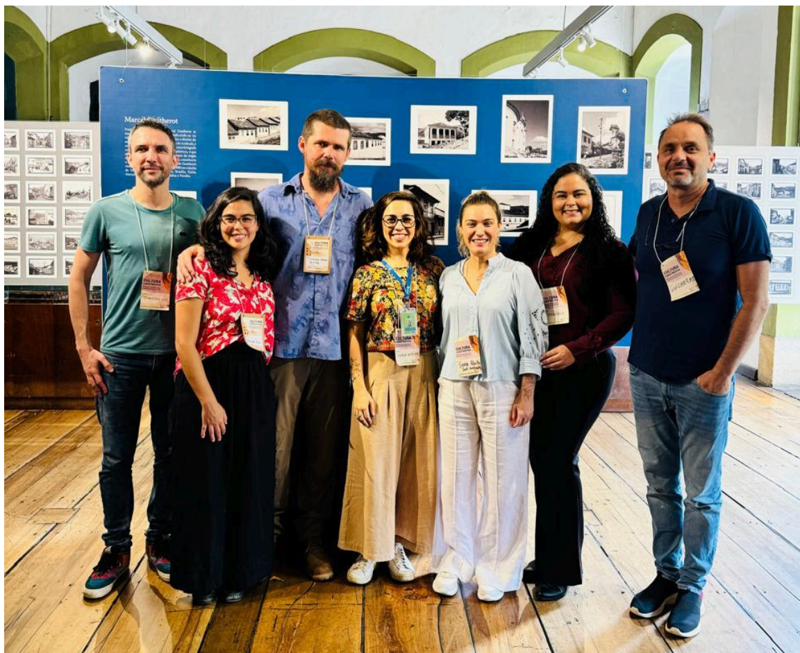
Representantes do Instituto Avaliação, A Pique e Plataforma Semente. Autoria: Francisco Luz Data: 04/12/2024

Ao final da visita, constatamos que as atividades previstas no projeto foram realizadas e satisfatoriamente recebidas pelos participantes.